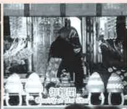
第24代即如門主 御親閉