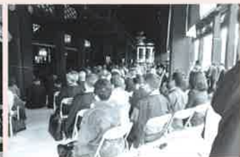
廊下まで参拝者が溢れ満堂の御影堂