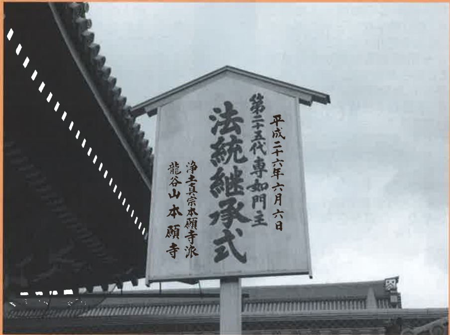
西本願寺 法統継承式 立札