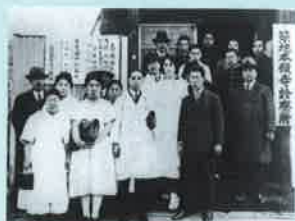
築地本願寺診療所にて